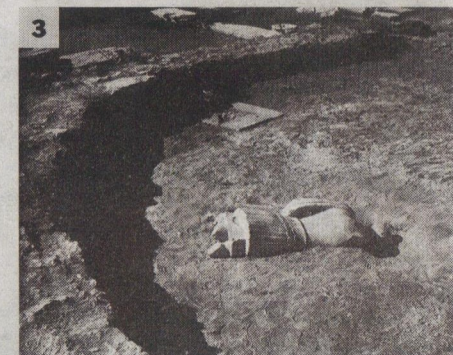
3. Εντυπωσιακό στιγμιότυπο από τις ανασκαφές στο Πάριον.