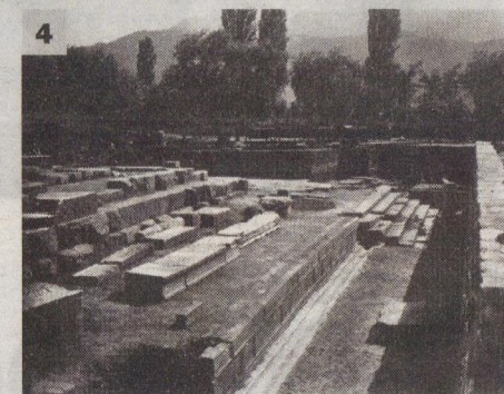
4. Το Ιερό του Ηρακλή στη Θάσο. Η πατρίδα του μυθικού ήρωα ήταν ίσως παλαιότερη της άφιξης των Παρίων.