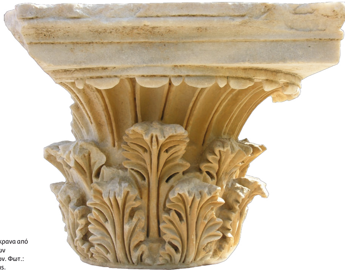
16 Κορινθιακά κιονόκρανα από το συγκρότημα των ρωμαϊκών λουτρών.