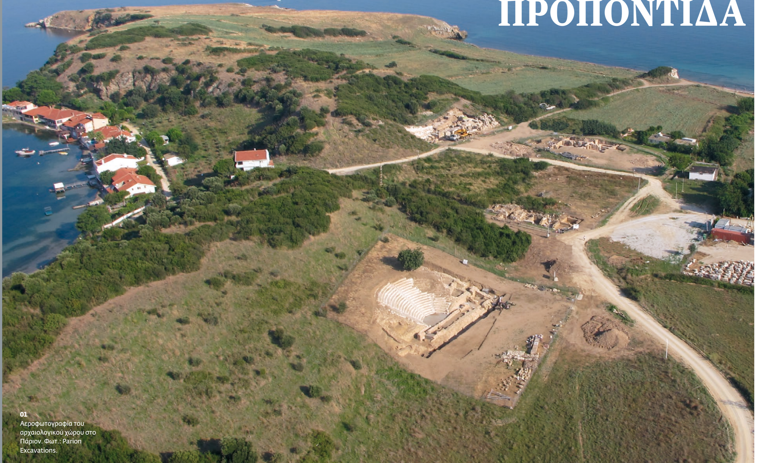
01 Αεροφωτογραφία του αρχαιολογικού χώρου στο Πάριον.